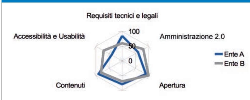
Fig. 1 - Rappresentazione radiale degli indicatori di qualità

La semplicità di rappresentazione degli indicatori in grafici radiali di immediata lettura e di immediato confronto facilita il processo di benchmarking (Fig. 1).